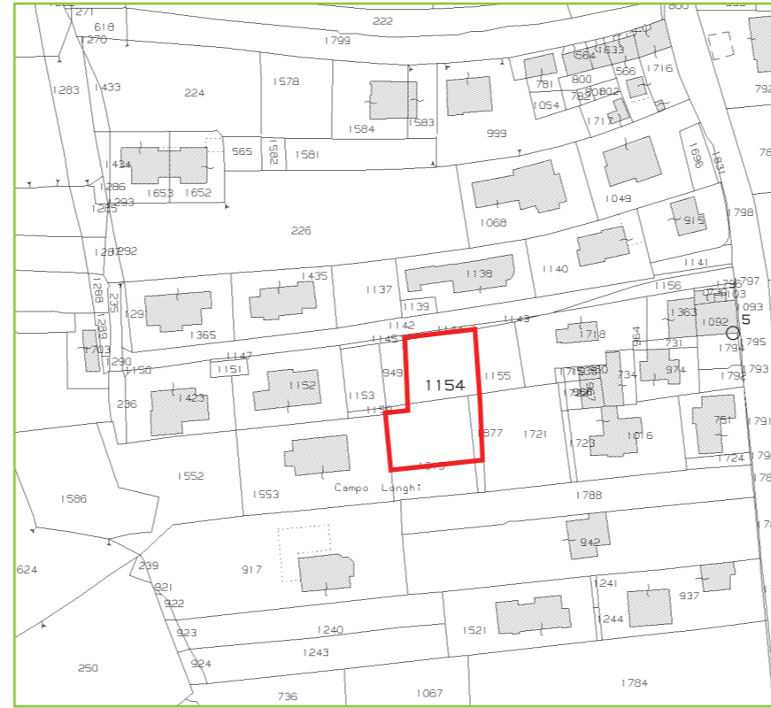
Estratto catastale scala 1:2000