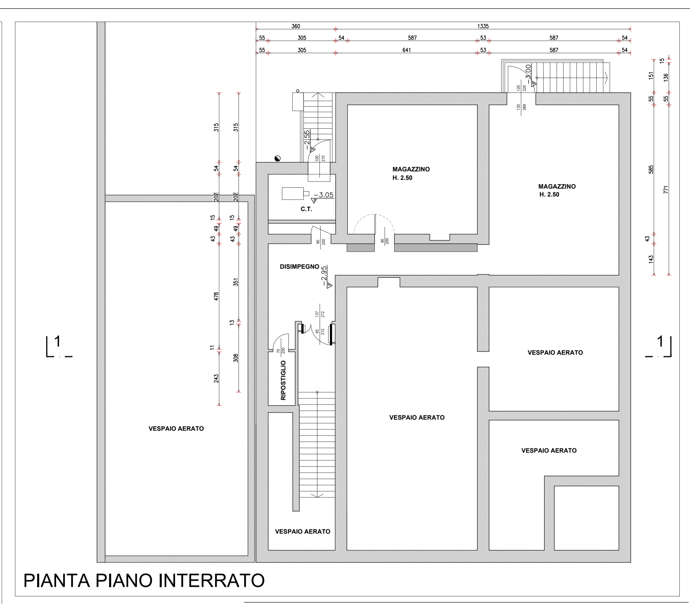
PIANTA PIANO INTERRATO